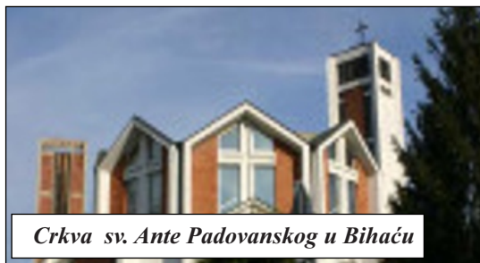
Crkva sv. Ante Padovanskog u Bihaću