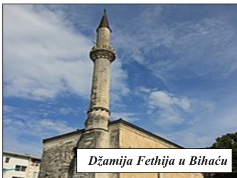
Džamija Fethija u Bihaću

Pođimo u Bihać, gradi središte istoimene općine u sjeverozapadnom dijelu Bosne i Hercegovine te upravni centar Unsko-sanske županije u Federaciji BiH. Ima oko 46 000 stanovnika. Smješten je u Bihaćkom polju ispod brda Debeljača podno planina Plješevice i Grmeča, s obje strane Une – najljepše rijeke, a tu su i njezine pritoke Klokot i Privilica. Na zapadu graniči s općinama Hrvatske: Donji Lapac i Plitvička jezera-Korenica, na sjeveru s Cazinom, na istoku s Bos. Krupom i Bos. Petrovcem, a na jugu s općinom Drvar. Bihać je zanimljiv i lijep - grad prirodnih ljepota i povijesnih spomenika.