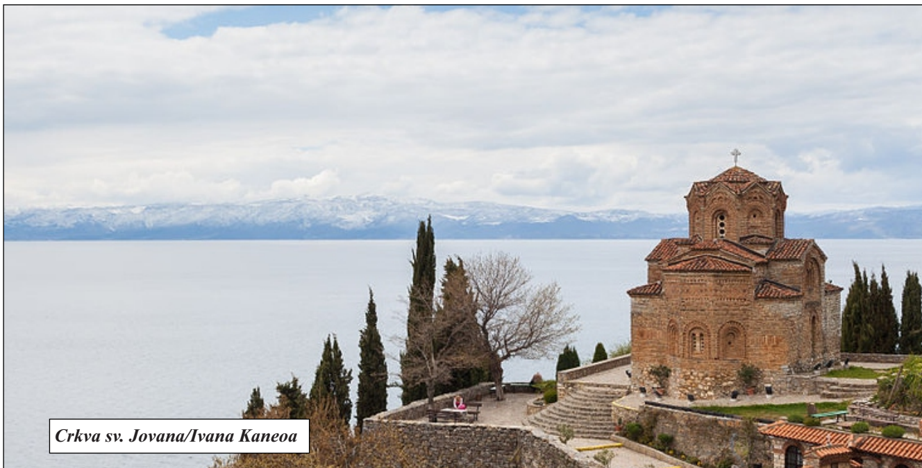
Crkva sv. Jovana/Ivana Kaneoa