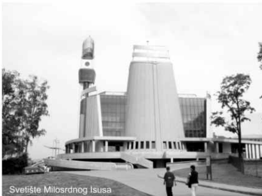
Svetište Milosrdnog Isusa

Krenuli smo 14. lipnja u pet sati iz Sarajeva. Putovali smo autobusom na kat. Među sedamdesetak hodočasnika bilo je mnogo redovnica: Milosredni-ce, Kćeri Božje ljubavi, Školske sestre