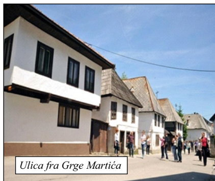
Ulica fra Grge Martića

Subota je, 10. lipanj 2023. S prijateljima idem na izlet u Kiseljak i Kreševo. Vrijeme je mutno, tamni oblaci nas ispraćaju iz Sarajeva. U Kiseljaku nas dočekuju s poznatim „kiseljačkim pogačicama“, a i sunce se probilo kroz oblake. Kad smo stigli u Kreševo već je vruće. Ljubazno nas dočekuje prelijepi ambijent oko crkve Uznesenja Blažene Djevice Marije i samostana sv. Katarine.