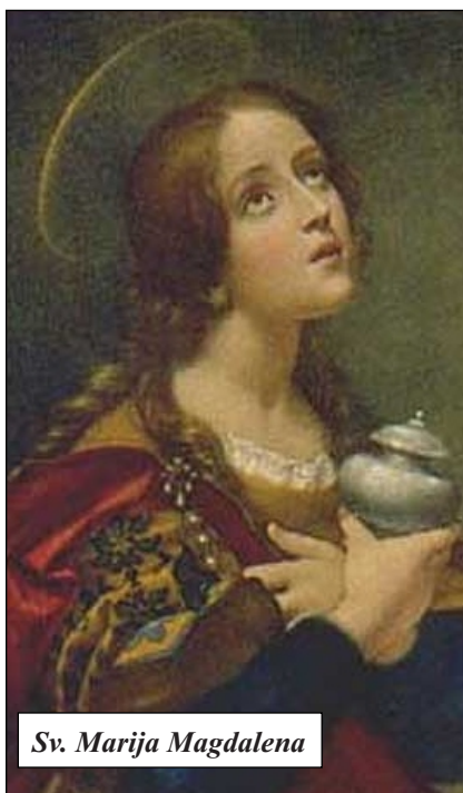
Sv. Marija Magdalena