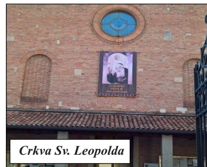
Crkva Sv. Leopolda

Uz nju je i kapelica relikvija koja, uz svete moći, čuva i kamen na kojem se sv. Anto često odmarao. No, bazilika krije još jednu znamenitost. Naime, u njezinom prezbiteriju nalazi se veliki svijećnjak koji je svojom veličinom i umjetničkom izradom proglašen najljepšim svijećnjakom na svijetu. Uz baziliku je i franjevački samostan, sastavljen od nekoliko zgrada, od kojih je posebno atraktivan Klaustar magnolije, nazvan po najvećoj magnoliji koju smo ikada vidjeli, a koja raste na sredini travnjaka ispred koje je kip sv. Ante s malim Isusom.