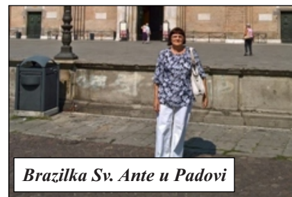
Bazilika Sv. Ante u Padovi

U bazilici sv. Antuna, odnosno mjestu njegovih zemnih ostataka euharistiju predslavi fra Petar Karajica. Jedna je to od najpoznatijih i najposjećenijih crkava u kršćanskom svijetu koja, osim groba ovog sveca, čuva i brojna umjetnička djela. Bazilika ima devet kapelica, osam kupola, mnogo slika s prikazom Gospe... Središnje mjesto zauzima kapelica sv. Ante s njegovim grobom. Hodočasnici iz cijelog svijeta i turisti u tihom hodu i molitvi iskazuju svoje želje i zahvale Bogu po zagovoru ovog svetog čudotvorca, nalazitelja izgubljenih stvari, zaštitnika bolesnih, djece – nema tko se ne utječe sv. Anti - svecu cijelog svijeta.