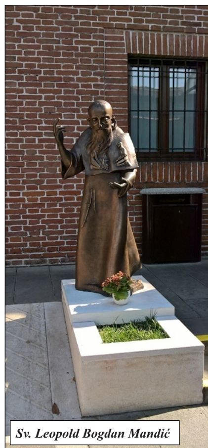
Sv. Leopold Bogdan Mandić

Svatko hodočasti iz razloga samo njemu poznatih. Ali, posjećujući tolika znamenita mjesta vidjeli smo samo upornost u molitvi, poniznost i solidarnost. Želimo li prihvatiti poniznost, strpljivost otvarajući se Božjoj milosti? Koliko ćemo i hoćemo li se promijeniti?