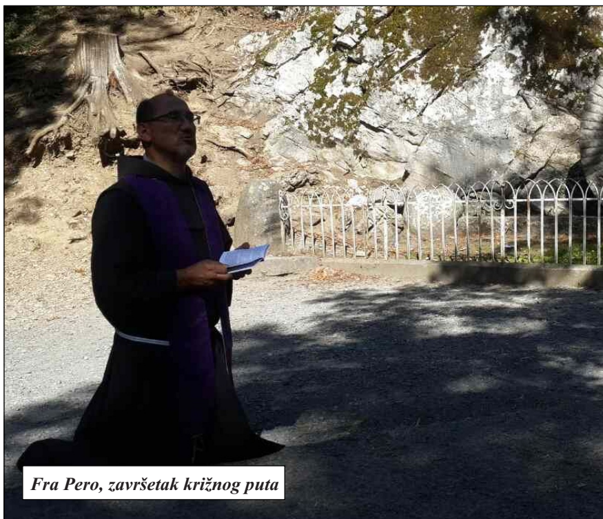
Fra Pero, završetak križnog puta

Imamo Leopoldovo svetište i u našoj domovini. U Maglaju je 17.6.1979. otvoreno prvo svetište sv. Leopolda na području bivše Jugoslavije. U moćniku ovog svetišta nalazi se najveća relikvija sv. Leopolda u našoj zemlji – dio njegove svete desnice. Vrlo je značajna i ispovjedaonica, koja je u svim pojedinostima vjerna kopija ispovjedaonice u samostanu Svetog križa u Padovi. U Sarajevu na Briješću je župa posvećena sv. Leopoldu Mandiću. U rodnom gradu sv. Leopolda u Hercegrovom (C. Gora) gradski park nosi ime ovog sveca.