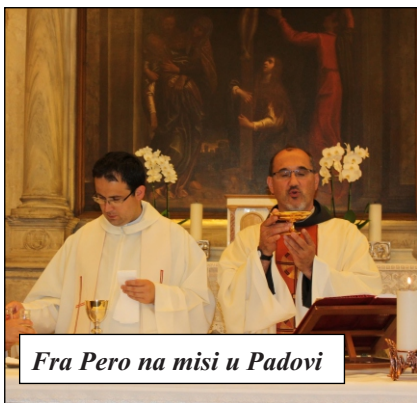
Fra Pero na misi u Padovi

U kratkoj smo posjeti veličanstvenoj crkvi sv. Justine mučenice iz Dioklecijanova vremena, zaštitnice Padove. Osim sarkofaga s relikvijama sv. Justine, ujedno i glavnog crkvenog oltara, bazilika čuva i relikvije sv. evanđelista: Luke i Mateja. Sv. Luka je rođen u Antiohiji. Neki smatraju da je umro u dubokoj starosti. Bio je suradnik sv. Pavla i njegov suputnik na misijskim putovanjima. Napisao je Evanđelje i Djela apostolska. Neki podatci govore da je bio liječnik, a spominje se i kao slikar Isusa i Majke Božje. Postoji nekoliko slika Blažene djevice Marije za koje se vjeruje da ih je naslikao upravo sv. Luka, pa i ova koja se nalazi ovdje iznad njegova sarkofaga. Matej (LeviAlfejev) apostol bio je carinik,