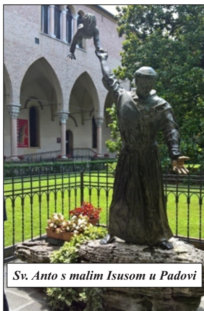
Sv. Anto s malim Isusom u Padovi

Poslije doručka 7.7. ponovno smo u autobusu do Padove. Na ovom putovanju Padova je naše zadnje hodočasničko odredište, smještena u talijanskoj provinciji Veneto. Grad s 200 000 stanovnika. Naselje postojalo u neolitikumu. Raslo, i propadalo u ovisnosti od povijesnih okolnosti. Od rimskog vremena, preko Gota, Langobarda do mletačke vlasti. Potom je u sustavu Austrije, Napoleona, a od 1866. u novonastaloj kraljevini Italiji. U Padovi su djelovali Dante, Giotto, Galileo... Ovdje je sveučilište od 1222. Botanički vrt iz 1545 sada je pod UNESCO-vom zaštitom. Mi smo u Padovi zbog sv. Ante (Lisabonskog) Padovanskog i sv. Leopolda Bogdana Mandića.