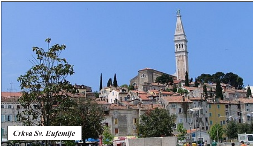
Crkva Sv. Eufemije

crkva sv. Eufemije (Fume), koja stražari iznad grada svojim visokim zvonikom i kipom sv. Eufemije družeci se s oblacima i zvijezdama. U Rovinju sam bila prvi put 1970. s prijateljima i naravno, posjetili smo crkvu sv. Eufemije. Tada sam prvi put vidjela sarkofag i tijelo. Ne znam kako bih opisala osjećaj – uglavnom zbunjenosti i nelagode. Inače, pri susretu s balzamiranim tijelima ili dijelovima tijela svetaca obuzme me neobjašnjiv osjećaj tuge. Zapravo, pri takvu susretu ne doživim ništa osim osjećaja nelagode. No, to ne znači da tisuće hodočasnika i štovatelja ne budu ganuti tim susretima, pa tu iskazuju svoje zahvale Bogu, kajanja, molbe i nade.