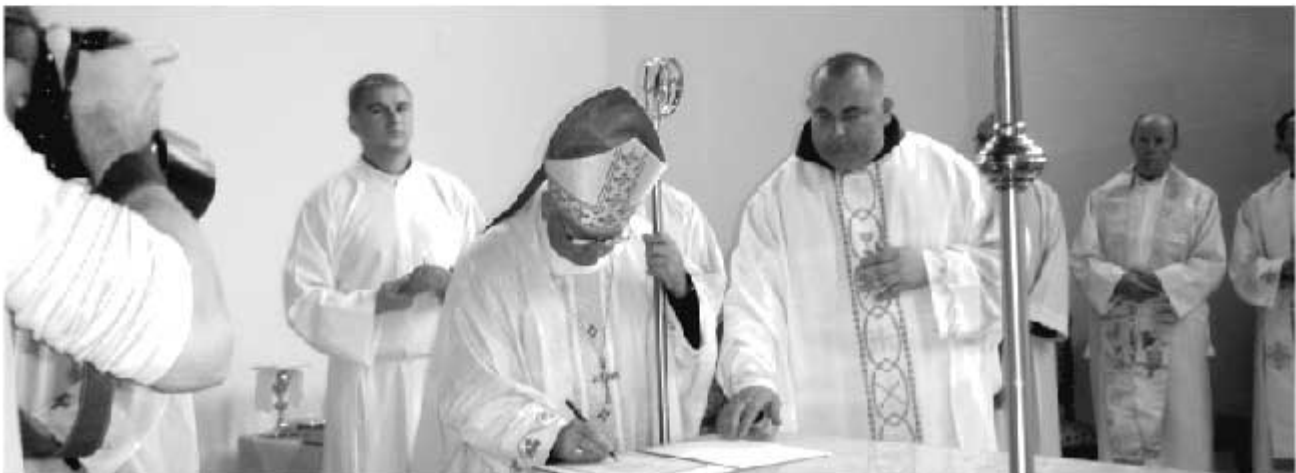
S. Kovačić, Katolici u kotor-varoškom kraju, Svjetlo riječi, Sarajevo, 1989., str. 138.-139

- Kad se sokolska župa odvojila od Kotorišća 1872. Postolje je pripalo toj župi. Međutim, kad je osnovana i vrbanjska župa jedan dio dodijeljen je njoj. U ovom djelu našeg rada bit će govora samo o vrbanjskom dijelu Postolja.