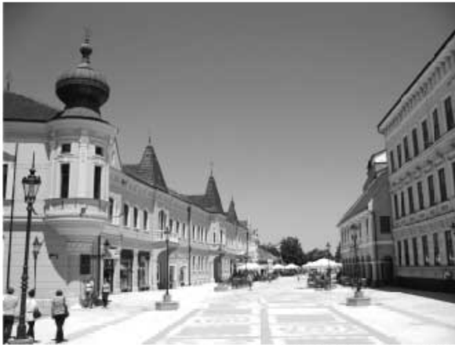
Vinkovci - glavna šetnica