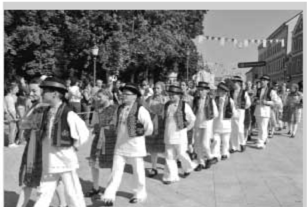
Dječje vinkovačke jeseni

Iako su poštovana mnoga bčžanstva (Jupiter, Minerva, Herkul, Neptun, Liber i Libera, Venera, Dijana, Silvan, Mitra, Kibala), kršćanstvo je rano prihvaćeno u ovom području. Otomu govore brojni nalazi iz prve polovice trećeg stoljeća, a sačuvana su imena cibalitanskog biskupa Euzebija i p sara Poliona koji su umrli mučeničkom smrću u vrijeme rimskih progona kršćana. Sadašnja župna crkva u Vinkovcima posvećena je njima. To je barokna crkva izgrađena 1777. Vinkovčani je zovu „velika crkva“ Nalazi se u središnjem parku na glavnom gradskom trgu bana Josipa Šokčevića (rođen u Vinkovcima 1811. - umro u Beču 1896.). Bila je posvećena sv. Nepomuku, a od šezdesetih godina patroni su joj sv. Euzeb je i Poion, koji se slave 29. svibnja. U toj crkvi smo bili na nedjeljnoj misi u devet sati. Crkva je doslovce puna. Pitan gospođu, pored mene, je li uvijek ovoliko svijeta na misi govoreći joj da sam iz Sarajeva, a ona „I ja sam iz župe Presvetog Trojstva Novo Sarajevo. Otišla u ratnoj 1992. godini i ostala“. Kaže ima više misa i uvijek je crkva puna. U ovoj crkvi se služi i misa za sudiorike mimohoda Vinkovačkih jeseni. U istom parku je i zgradu u secesijskom stilu na čijem uglu je spomen ploča Josipu Runjaninu, skladatelju hrvatske Himne na kojoj piše: Josip Runjanin, shiritilac napjeva hrvatske himne. Rođen u Vinkovcima 8.12.1821. Umro 2.2.1878. u Novom Sadu Klub hrvatskih književnika iz Osijeka. MLMXXI. Na Trgu je spomenik Presvetom Trojstvu, a