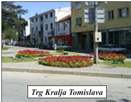
Trg Kralja Tomislava

U sklopu samostana je najstariji muzej u našoj državi od 1884. Uz predmete prikupljene na području Hercegovine tu je i „Humačka ploča“, najstariji sačuvani pisani spomenik na hrvatskom jeziku.