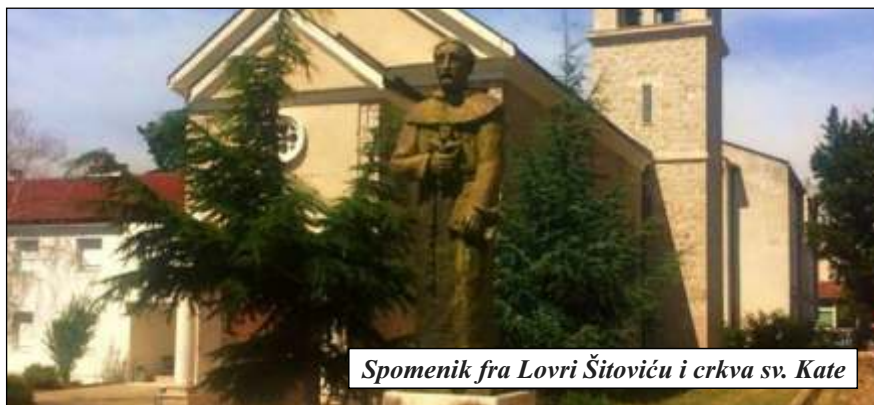
Spomenik fra Lovri Šitoviću i crkva sv. Kate

Fratri prikupljaju i knjige, pa se može reći da njihova knjižnica djeluje od 1867. Smještena je u posebno uređen prostor i broji preko 20 000 knjiga iz svih područja prirodnih i društvenih znanosti. Uz mnoga znamenita djela zanimljiv je raritet Homerova „Ilijada“ i „Odiseja“ tiskane