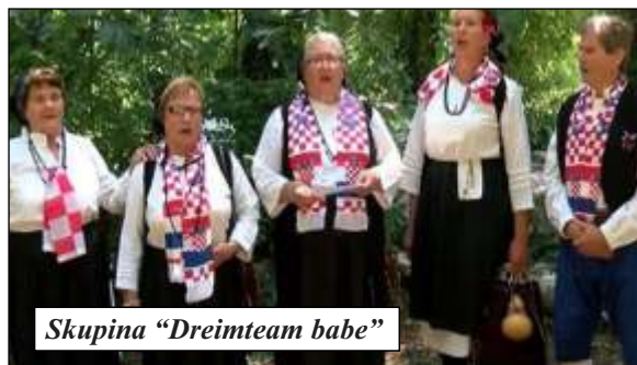
Skupina „Dreimteam babe“

Ljubuški je pod turskom vlašću nakon pada Počitelja 1472. Turci su učvrstili i proširili tvrđavu, dogradili