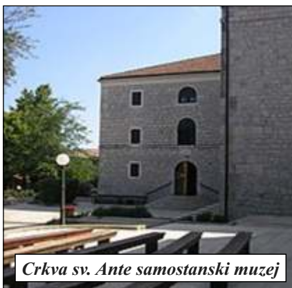
Crkva sv. Ante samostanski muzej

Ljubuški se smjestio na zapadu Hercegovine uz granicu Republike Hrvatske. Općinsko je sjedište. Prostire se od vrha Buturovice u Ljubuško poljeprema Trebižatu. Susjedne općine su Čapljina, Čitluk, Grude i Široki Brijeg te Metković i Vrgorac prema Republici Hrvatskoj. Na značajnim je prometnicama prema Mostaru (36 km), Makarskoj (55 km), Splitu (120 km), Dubrovniku (130 km) i Sarajevu (170 km). Po posljednjem popisu stanovništva općina ima više od 28 000, a grad oko 5 000 stanovnika. Ljubuški se spominje 1435. i 1438. u pisanim dokumentima, ali svoj dan slavi 21. veljače. Na taj dan je 1444. dubrovački trgovac Gojслав Orlović pisao testament u kojem spominje dar crkvi u Ljubuškom.