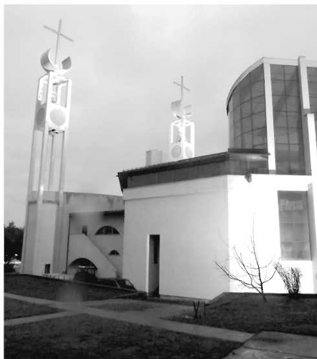
S. Kovačić, Katolici u kotorvaroškom kraju, Svjetlo riječi, Sarajevo, 1989.