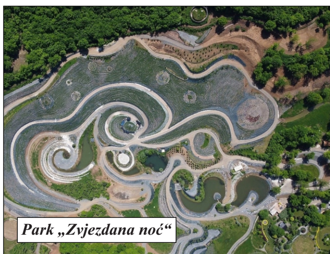
Park „Zvezdana noć“

14. stoljeća. Preživio je dolazak Turaka. Srušen je tek 1524. Franjevci i katolici su opstali sve do 1697. kada su napustili ovaj kraj s Eugenom Savojskim, koji je došao osloboditi Bosnu od Turaka, a sada izgleda, da ju je oslobodio od njezinih stanovnika, jer je veliki broj katolika tada napustio Bosnu. Franjevci su se vratili u Visoko 1899. Izgradili su zgradu gimnazije po projektu Ivana Holza. Prva gimnazija utemeljena je 1882. i bila je u Kreševu, pa u Gučoj Gori, a 1900. učenici su iz Guče Gore preseljeni u Visoko u novu zgradu gimnazije. Ona je kasnije proširivana i dograđivana. Uz nju je