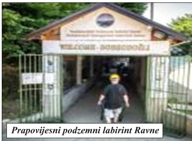
Prapovijesni podzemni labirint Ravne