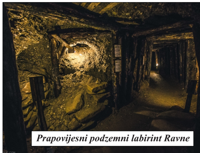
Prapovijesni podzemni labirint Ravne